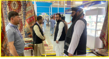
قالین، صنایع دستی، احجار گرانبها و نیمه گرانبها، زعفران، میوه خشک و تولیدات مختلف افغانستان به نمایش گذاشته شده بود. قرار است این نمایشگاه تا روز شنبه هفته جدید در این کشور ادامه داشته باشد.

وزارت صنعت و تجارت می‌گوید که تولیدات افغانستان در یک نمایشگاه شش روزه در کشور چین به نمایش گذاشته شد. این نمایشگاه تولیداتی روز (سه‌شنبه، ۲ اسد) با همکاری چین و کشورهای جنوب آسیا در شهر کنمینگ در ولایت یون کشور چین برگزار شده بود. بر بنیاد گزارش‌ها در این نمایشگاه بزرگ تولیداتی ۴۱ غرفه برای تولیدات و فرآورده‌های افغانستان اختصاص داده شده بود. از سوی هم در این نمایشگاه ۸۲ کشور، سازمان‌های منطقه‌ای و جهانی و بیش از دو هزار شرکت اشتراک دارند. گفتنیست که در این نمایشگاه بزرگ تولیداتی